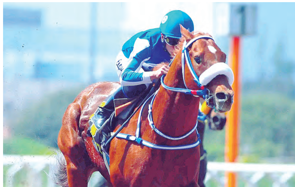
El hijo de Sherezada es la vedette de la jornada

Claro está, la carrera de Abundancia de enorme mérito pues, la alazana enfrentó esa Polla de Potrancas (G1), con una