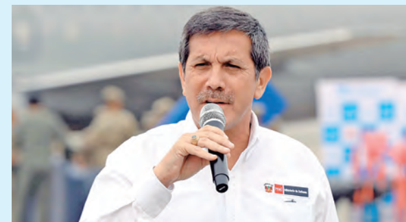
MINISTRO DE DEFENSA:

“Entonces, ese es el trabajo que se tiene que hacer, porque tú le invitas a una ministra de Dina Boluarte, la botan. O invitas a Sigrid Bazán, y también la botan. Entonces, yo creo que es el momento en que cada sociedad regional va a tener que dialogar y, sobre eso, digamos, el Gobierno tendrá que buscar una salida, en fin”, refirió.