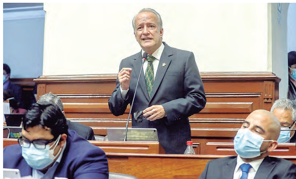
Fujimorismo pretende burlarse como lo intentó hacer en la dictadura de los noventa.

BANCADA DE FUERZA POPULAR plantea elecciones generales para el mes de diciembre de 2023, sin embargo, las autoridades elegidas se quedarían hasta julio de 2024.