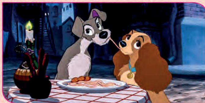
Solución: 1. Flama de la vela 2. Oreja de Goffo 3. Collar de Reina 4. Bollos de carne en el plato 5. Pared rota