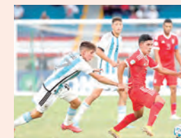
PERÚ EN SUB 20

de violencia. A pesar de la falta de garantías, la Liga 1 Betsson ha anunciado la programación de la tercera jornada para la próxima semana, aunque sin seguridad de que se pueda llevar a cabo.