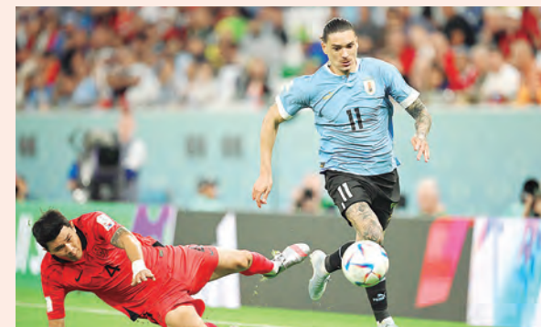
IGUALÓ 0-0 ANTE COREA DEL SUR

Ghana aprovechó la floja marca de Cancelo para que Bukari marcara a los 89' y en tiempo de compensación bien pudo sellar el empate ante el error del meta Diogo.