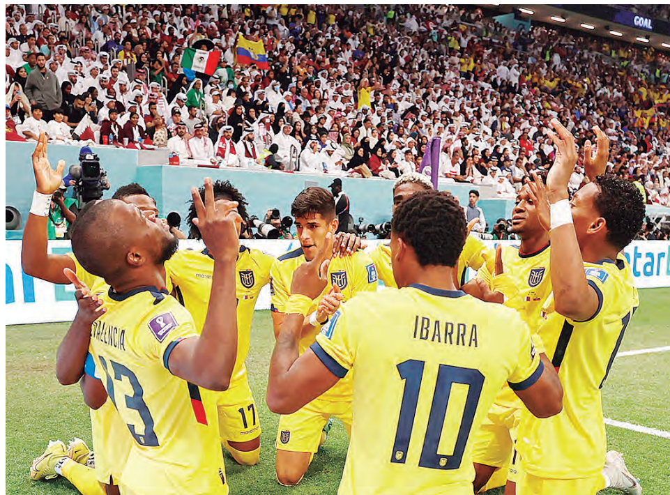
Los ecuatorianos en un partido crucial ante los "tulipanes".

Pese al 2-0 logrado ante Senegal, no convenció mucho el accionar de los "tulipanes", quiénes recién en los minutos finales, hicieron la dife-