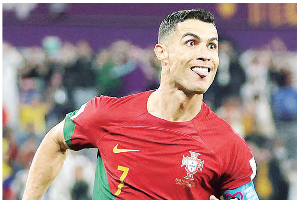
Ronaldo anotó en cinco mundiales diferentes.

dos atacantes, André Ayew e Iñaki Williams también tenían la misión de marcar.