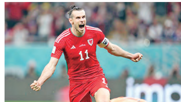
Gareth Bale anotó 40 goles con su selección.

Gales: W. Hennessey; Ben Davies, J. Rodon, Ampadu; Ramsey, Allen, Neco Williams, C. Roberts; Bale, James, Moore