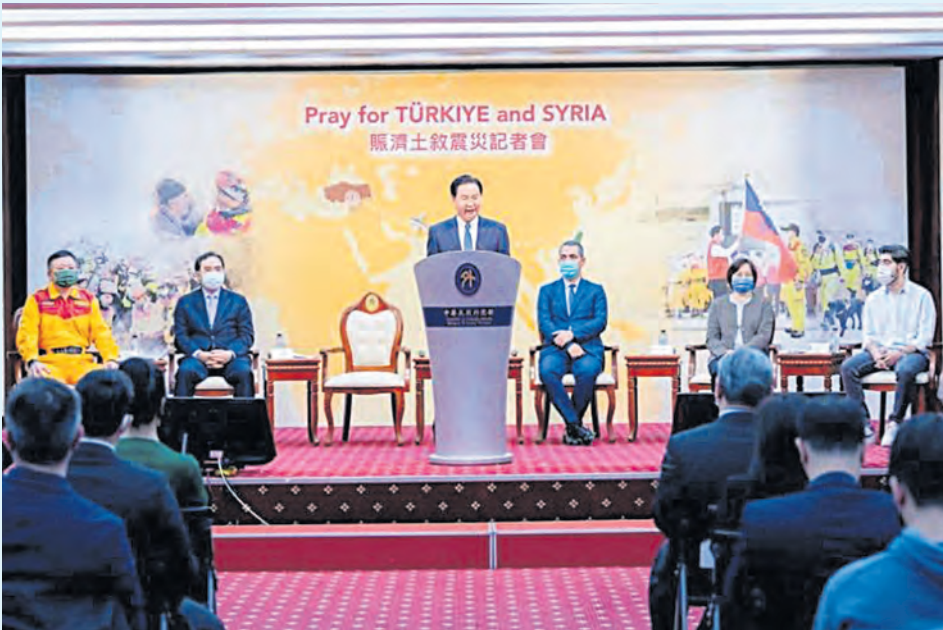
El ministro de Relaciones Exteriores, Jaushieh Joseph Wu, anunció una donación de 20 millones de dólares estadounidenses a Turquía y a Siria en la ciudad de Taipei el 18 de febrero.

El ministro de Relaciones Exteriores, Jaushieh Joseph Wu, anunció una donación de 20 millones de dólares estadounidenses a Turquía y a Siria el 18 de febrero para ayudar a los dos países en la reconstrucción posterior al terremoto, informó el Ministerio de Relaciones Exteriores (MOFA, siglas en inglés).