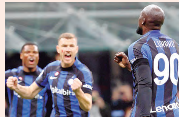
CALCIO: VENCÍO A UDINESE 3-1

y sigue en antepenúltimo lugar, donde su rival de ayer (Groningen) es colero con solo 11 unidades.