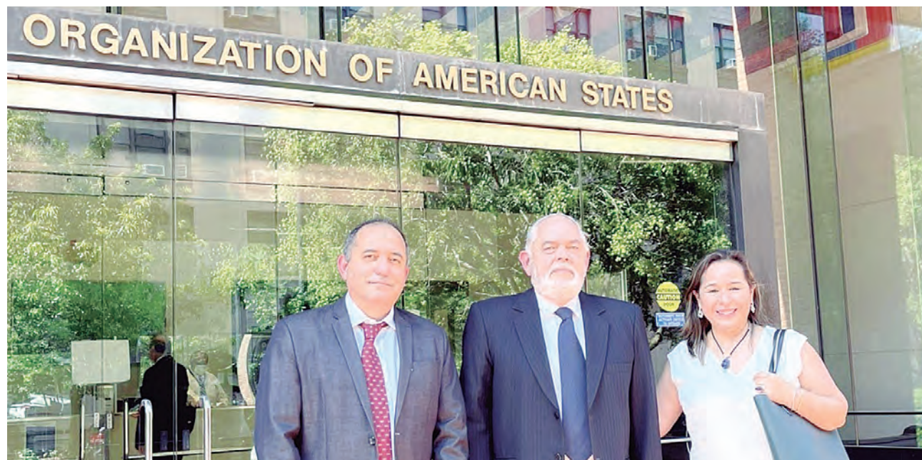
Aquellos tiempos (2021) Montoya en Washington tocando puertas de la OEA, cuando creía en el Sistema Interamericano.

resaltar, el momento en que está ocurriendo este pedido. “Los de Renovación Popular están evaluando que como que ya han logrado convencer a la presidenta Boluarte de tener una acción represiva contra los manifestantes con 60 muertos encima. Y que, por lo tanto, no es el momento que el Sistema Interamericano e instancias internacionales metan la nariz en el Perú. Me parece que a eso apuntan, darle al Gobierno precario de Boluarte y de Otárola un instrumento político más para armar una discusión, en un sentido que no corresponde”.