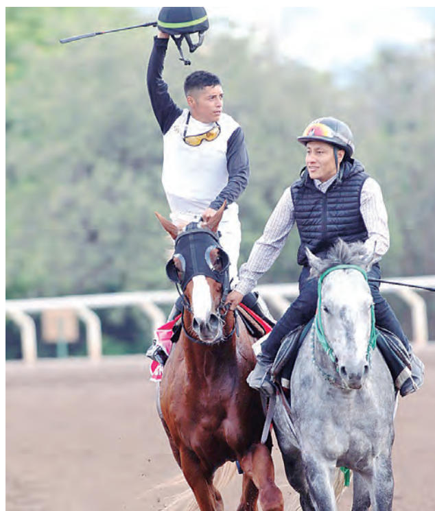
El del Santa Rosa viene de ganar el Ciudad de Lima

nientes de salud que lo imposibilitan de actuar en carreras públicas este fin de semana.