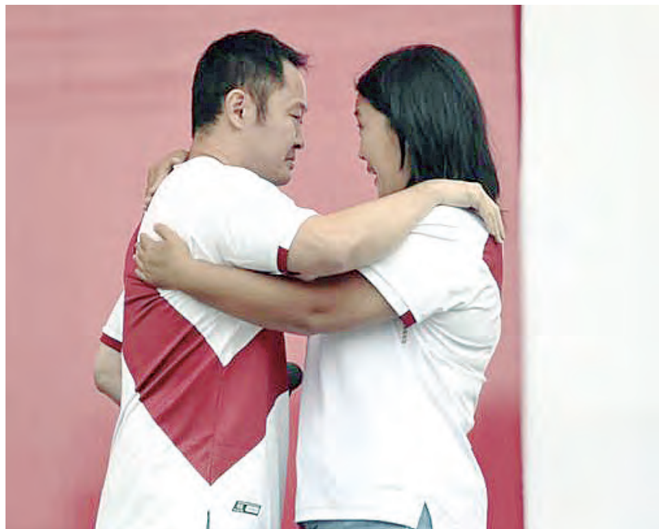
En las pasadas elecciones Keiko se amistó con su hermano Kenji en un acto proselitista.

“Sin embargo, hemos visto también una extraña coincidencia entre los extremos: entre la extrema derecha y la extrema izquierda, que lamentablemente boicoteó esta salida, poniendo excusas, poniendo pretextos queriendo supuestas reformas o señalando que querían una Asamblea Constituyente, respectivamente. Cuando se sabe que no hay los votos. Incluso utilizándome a mí, diciendo que todo esto era porque Keiko Fujimori quería candidatear. Vuelvo a reafirmar que si hay un adelanto de elecciones no seré candidata presiden-