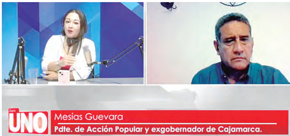
UNO Mesías Guevara Pdte. de Acción Popular y exgobernador de Cajamarca.

EL EXGOBERNADOR REGIONAL de Cajamarca y presidente del partido de la lampa asistió a la ronda de diálogos con el Ejecutivo.