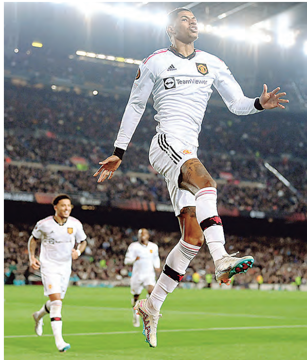
Rashford sigue anotando en todos los partidos.

BARCELONA DE LOCAL no pudo ante Manchester United e igualaron 2-2 en la Liga de Europa.