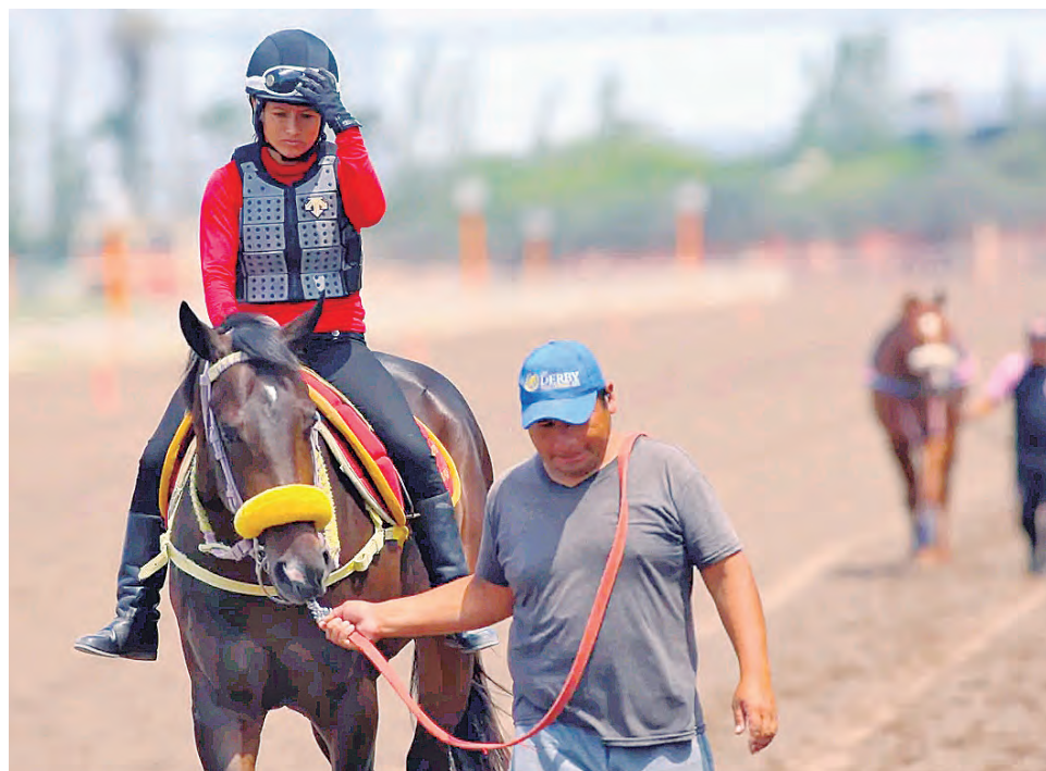
Este es Callejero, la carta del The Fathers

mano de Anastasia. Sandoval, hijo de Yazamaan, de los colores del Black Label, es otro que viene siendo alistado para la carrera.