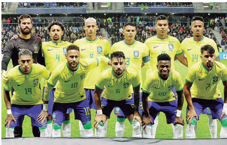
La selección de Brasil es siempre atracción en los mundiales.

En los últimos cuatro partidos, el técnico Tite puso 4 sistemas diferentes. 4-4-2, 4-2-2-2, 4-3-3 y 4-2-3-1. Este último quizás sea el utilizado por el entrenador para el mundial. Uno de sus principales problemas es que tiene muchos atacantes. Lucas Paqueta que bien puede jugar como