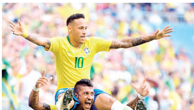
Neymar está a punto de superar en goles a Pelé

de punta y como delantero con un acompañante. Sin embargo, ante Ghana jugó de volante por izquierda y funcionó bien. Su ubicación ideal sería detrás punta. Curiosamente Richarlison es el elegido muchas veces para ser el centro delantero, cuando en sus clubes lo hace de extremo.