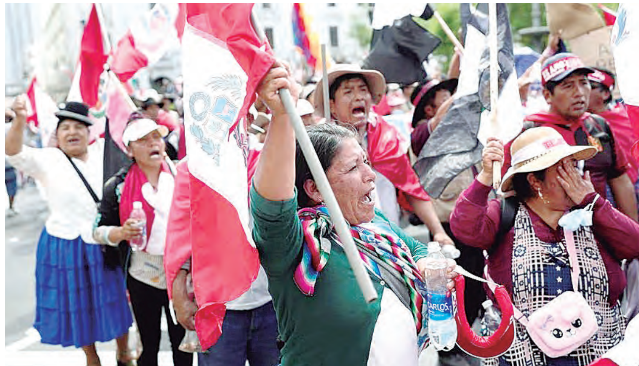
El Acuerdo del Consejo Metropolitano viola los derechos fundamentales de los ciudadanos.

“También nosotros a través de la Procuraduría de la Municipalidad Metropolitana de Lima iniciaremos las acciones legales severas, por supuesto con responsabilidad penal en la medida que se incumpla o vulnere esta disposición. Y eso también está incluido