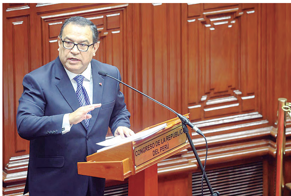
El titular de la PCM suma a la investigación por genocidio, otra por colusión.

LA FISCAL DE LA NACIÓN, PATRICIA BENAVIDES , abrió una investigación preliminar contra el presidente del Consejo de Ministros, Alberto Otárola, y el ministro de Trabajo y Promoción del Empleo, Alfonso Adrianzén.