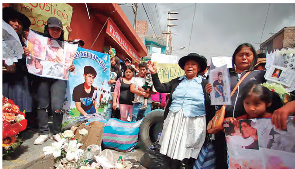
En el marco de las protestas y las muertes por la represión, optaron por debilitar las fiscalías de derechos humanos.

EN ESCUETO COMUNICADO PUBLICADO ante la presión por el revelador reportaje de IDL-Reporteros, el Ministerio Público da cuenta de “avances” en las investigaciones pero no tiene un solo inculpado por la masacre del 15 de diciembre.