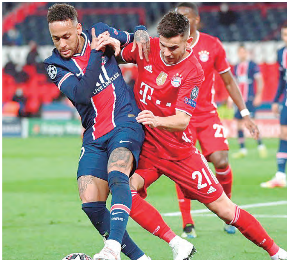
Neymar será de la partida ante los alemanes.

PARIS: Donnarumma; Danilo, Marquinhos, Sergio Ramos; Achraf Hakimi, Verratti, Fabián Ruiz, Nuno Mendes; Vitinha; Messi, Neymar. BAYERN: Sommer; João Cancelo, Upamecano, De Ligt, Davies; Kimmich, Goretzka; Sané, Musiala, Coman; Müller.