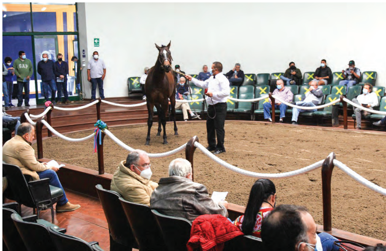
Lo mejor de la crianza nacional será presentado en Monterrico

Once haras nacionales ofrecerán lo mejor de su lote con juveniles que disputarán premios de 160 mil dólares el próximo año