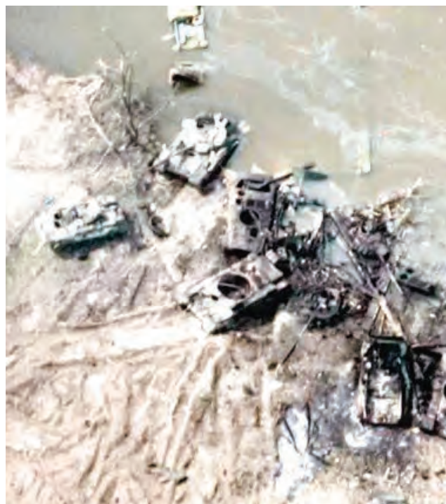
Más equipos militares destruidos de los rusos en su operativo espacial.

“Al parecer, los comandantes rusos intentaban rodear Lysychansk y su ciudad hermana, Severodo-