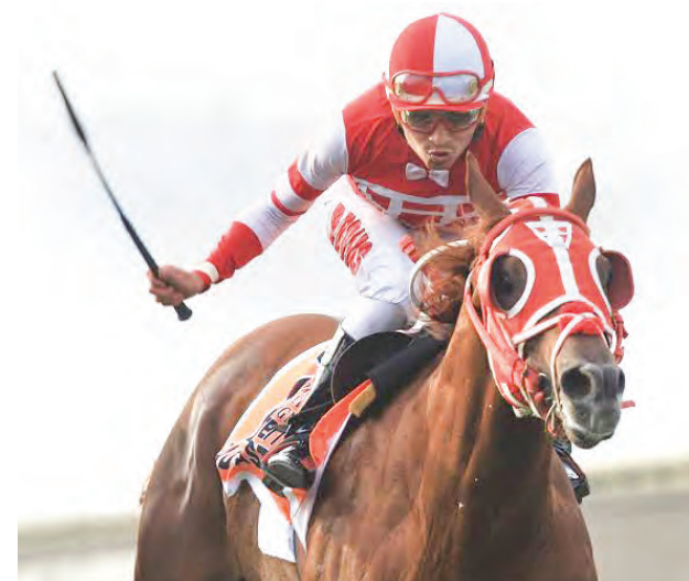
El crédito de El Herraaje a lucirse sobre el pasto

Carreras esta tarde en Monterrico, el espectáculo tendrá inicio a las 2 p.m. con 30 mil soles prometidos en la apuesta de la Cuádruple B. En la tercera de la jornada surge Radagast I con primera opción, el múltiple ganador clásico sobre el pasto baja al hándicap y con apenas 52 kilos está llamado a imponerse sobre King Diamond y Mazarin que asoman como rivales. En la sexta, Iniciativa ya mejoró y es una de las recomendaciones para esta reunión.