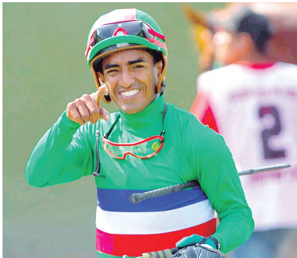
Asoma a Maxi de Salta e Insuperable Morena para ganar este sábado

ritmo bastante cómodo, como lo terminó siendo su victoria”, más de ocho cuerpos fue la ventaja que alcanzó aquella tarde el presentado por Alfonso Arias. “Pensé en todo lo bueno que me estaba pasando, en mi familia, son esos momentos que jamás se pueden olvidar”, refiere.