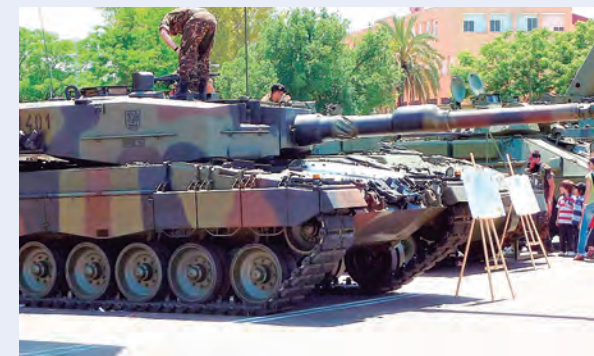
FIGURAS EN LA ALIANZA DE LA OTAN

Las preocupaciones sobre las grúas vienen inmediatamente después de la disputa entre Estados Unidos y China en febrero de 2023 debido a globos a gran altura. La Administración del presidente norteamericano Joe Biden derribó un supuesto globo espía frente a la costa de Carolina del Sur después de que se desplazara por todo el país, ante lo cual funcionarios de EEUU acusaron a China de utilizar esos globos en todo el mundo como herramienta de vigilancia.