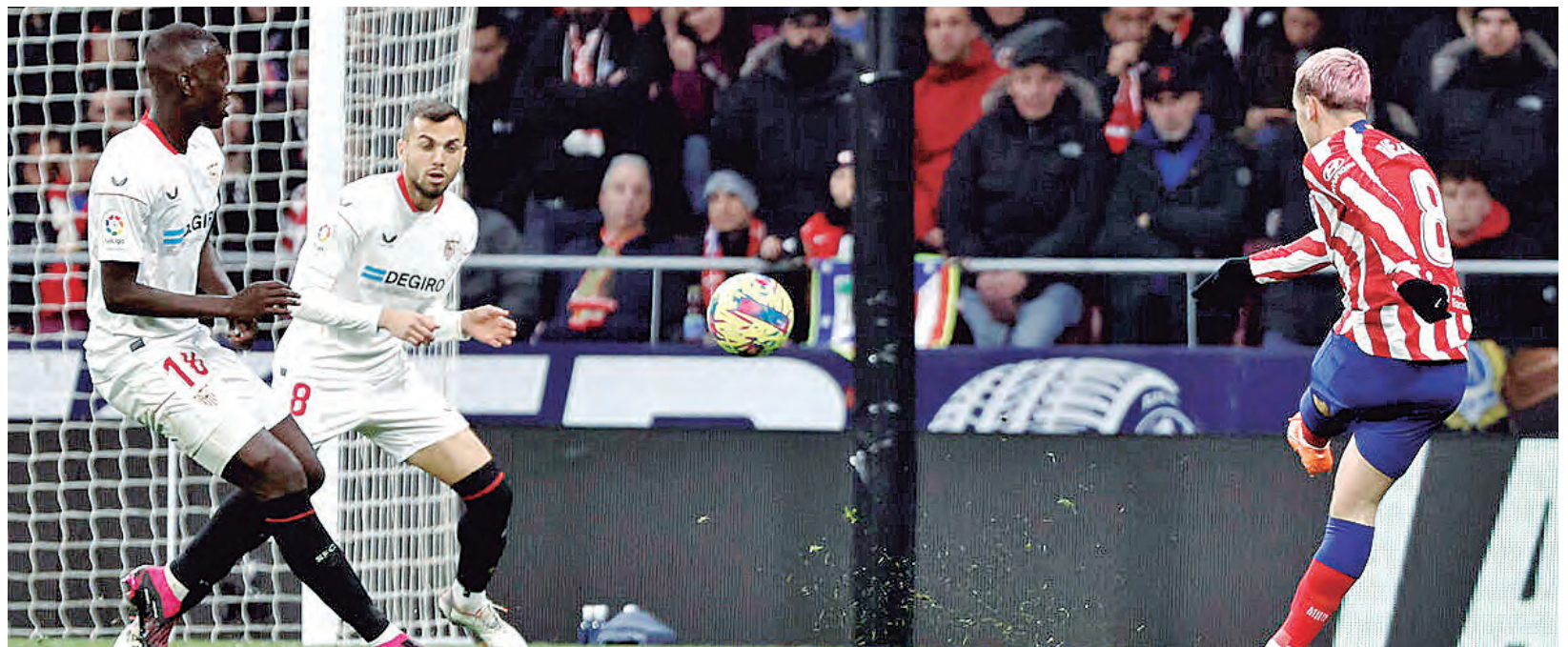
Griezmann anota el tercer gol "colchonero" en la valla de Bono.

El descuento del cuadro sevillista, fue del marroquí En-Nesyri a los 39', erran-