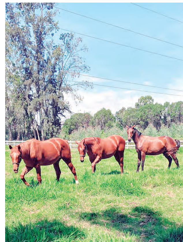
Son los hijos de hip One, Mantra y Yanahuara que ofrecerá, este año, el Myrna.

El lote cuenta con un macho, hijo de Hip One, por tanto, hermano de las ganadoras clásicas Mujer Divina y Kolinda. Y del buen Waldorf. También la hermana entera de Floyd y la segunda cría de la campeona Ikaya.