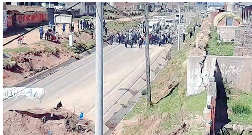
El pueblo de Juli rechazó la conducta intimidante de los militares.

“Corresponde al Ministerio Público investigar los