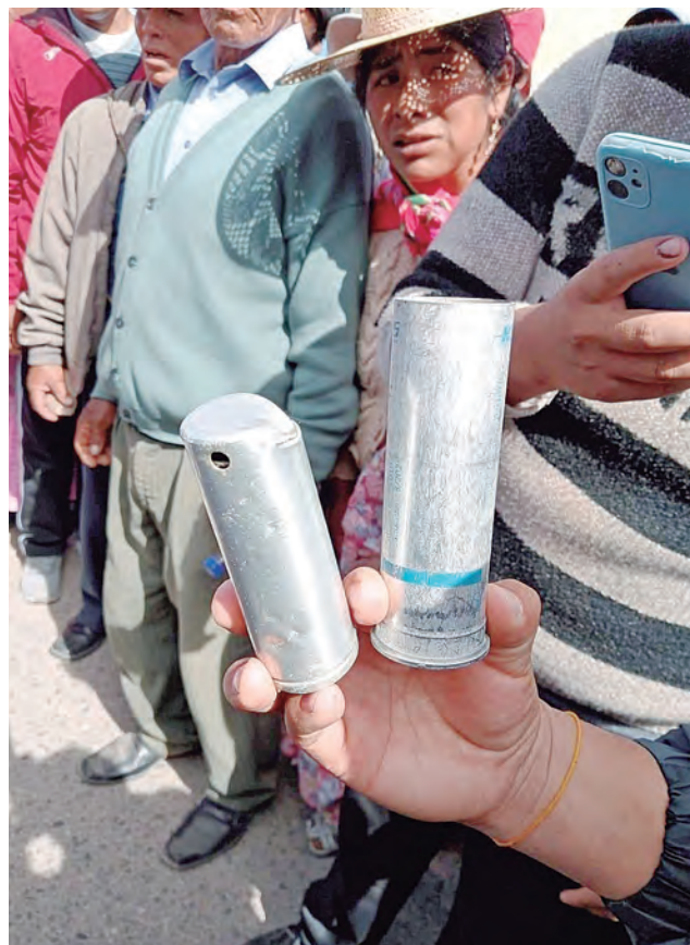
Proyectiles lacrimógenos, lanzados contra la población.

Se trata de diez civiles y seis integrantes de las Fuerzas Armadas, localizados en la provincia de