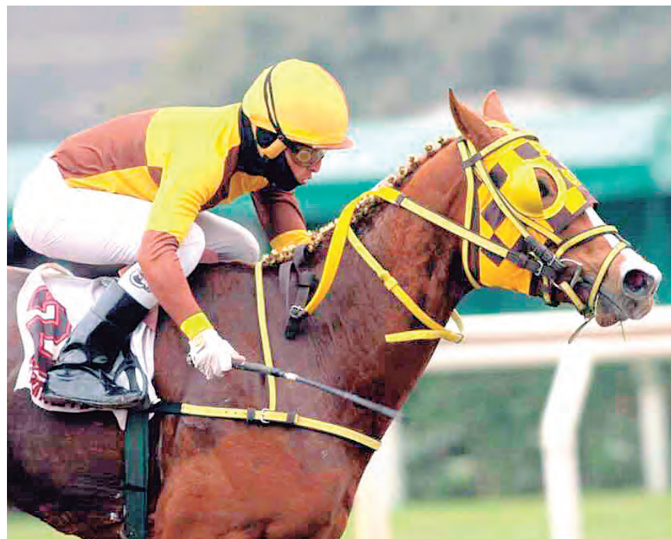
Tiger Lily expone su invicto