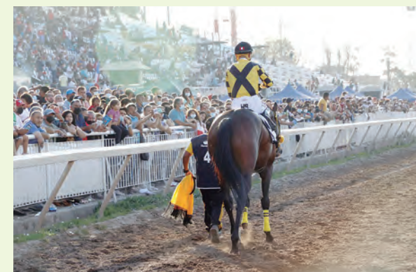
Así lucían las tribunas en la tarde que Super Corinto venció.