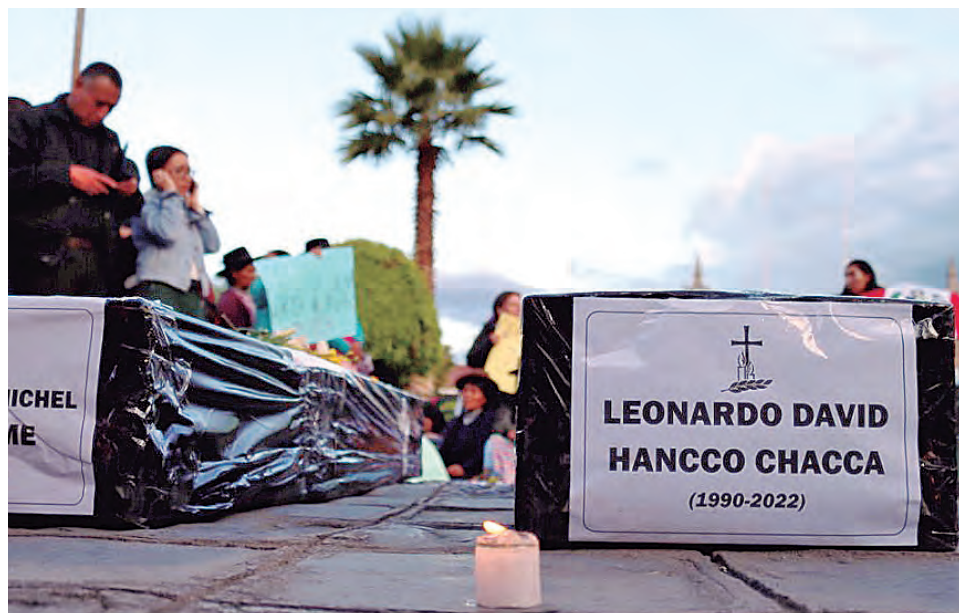
El pueblo peruano exige sanción a los responsables de las masacres.

visar y evaluar la política de seguridad y defensa nacional, pero en materia exclusivamente operativa que actúa, es el Comando Conjunto de las Fuerzas Armadas”, indicó Otárola.