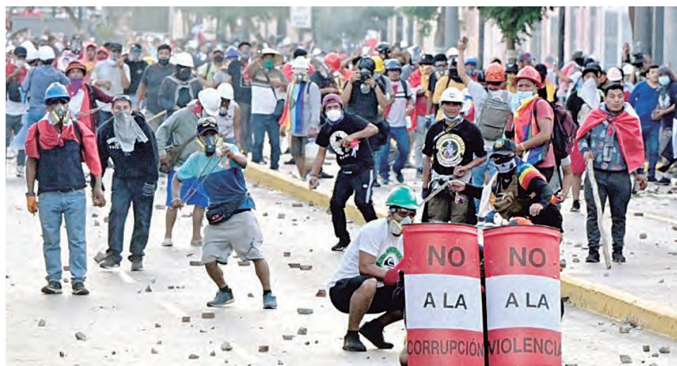
Las votaciones y decisiones pueden provocar un aumento de la convulsión social.

LA FALTA DE DECISIÓN para concretar una reforma constitucional que permita adelantar las elecciones generales al 2023, se puede convertir en un factor que alimente y multiplique las protestas.