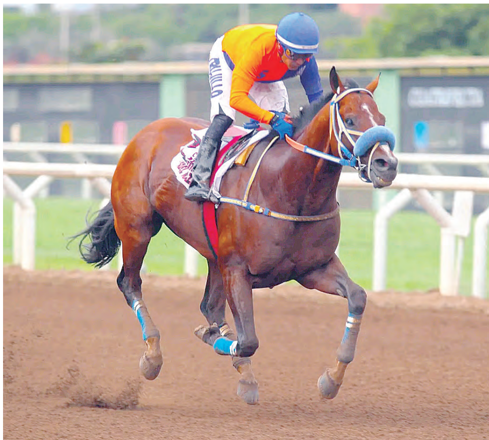
A sus siete años, el campeón del Soribel en plan estelar