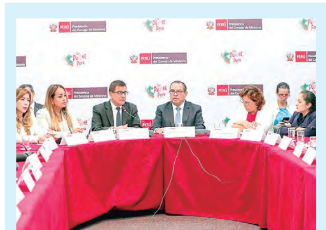
PREMIER ALBERTO OTÁROLA:

“Durante mi gestión pude conocer de manera directa los problemas que hoy viene experimentando la población afectada por las fuertes lluvias y el ciclón Yaku; por ello, presentamos algunas propuestas técnicas para iniciar algunas intervenciones rápidas de alto impacto, las mismas que sugiero no perder de vista”, finalizó.