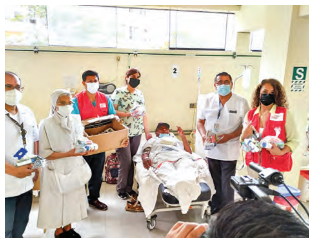
Proas y una interminable ayuda a los más necesitados.