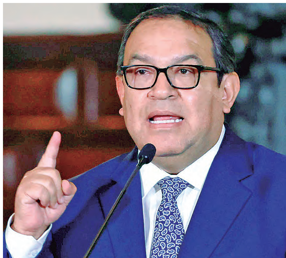
Todo parece indicar que quien manda en Palacio es el cuestionado premier.

Luego, dejó sin piso a la presidenta Boluarte, que el domingo había anunciado que “de no prosperar el adelanto de elecciones al 2023 el Ejecutivo estará presentando inmediatamente dos iniciativas legislativas con carácter de urgencia: la primera, una reforma constitucional para que las elecciones generales sean indefectiblemente este año 2023, la primera vuelta en octubre y la segunda en diciembre”.