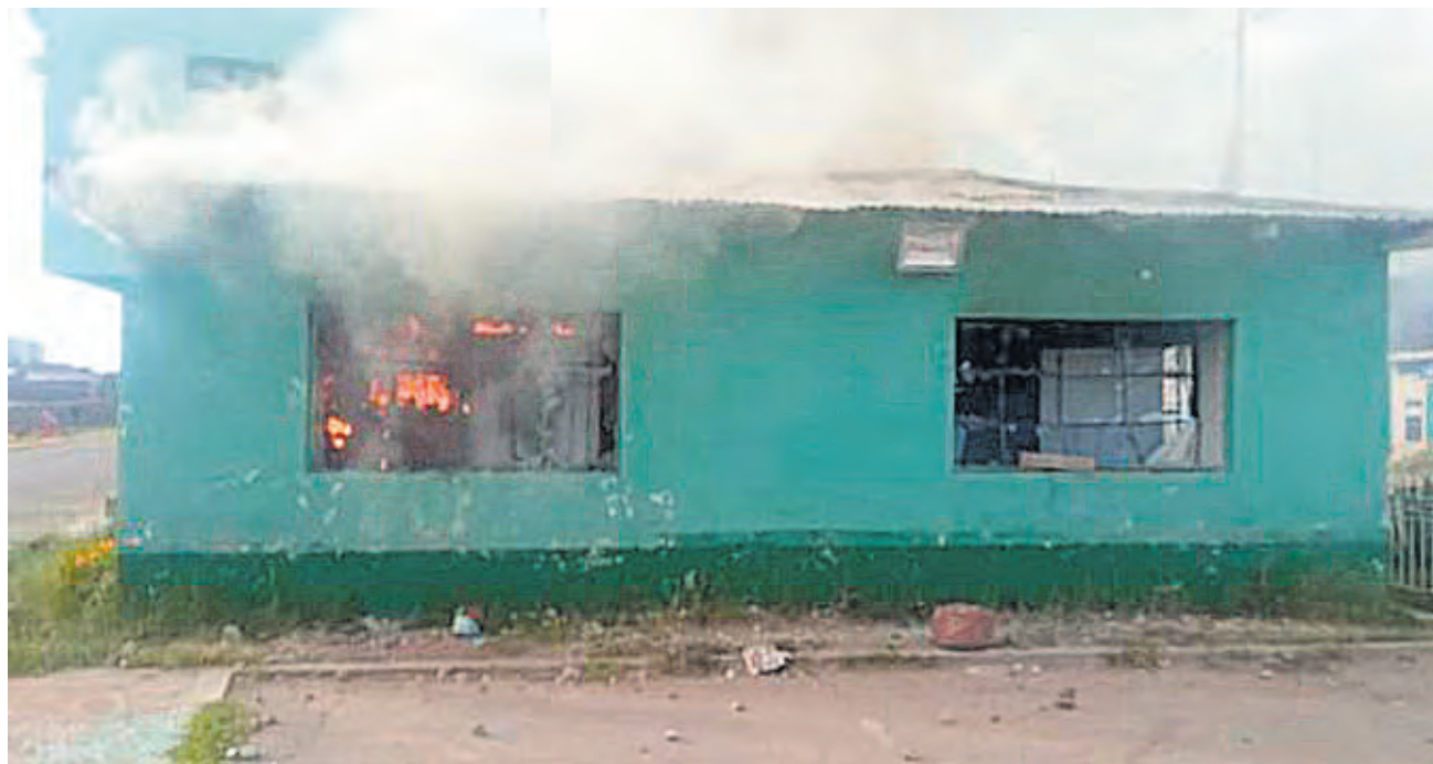
Prenden fuego a una comisaría en la localidad peruana de Huancabamba

-Considero en primer lugar que el país entero espera una reacción firme de las autoridades; que nuestra policía y nuestras Fuerzas Armadas hagan comprender a nuestros compatriotas que muchos peruanos están siendo utilizados por agitadores subversivos. Existen muchos peruanos de buena fe que protestan por sus carencias y necesidades, pero a ellos hay que explicarles, como en la época del terrorismo de los años 80 y 90, que están siendo utilizados y vilmente manipulados en contra de su propia nación.