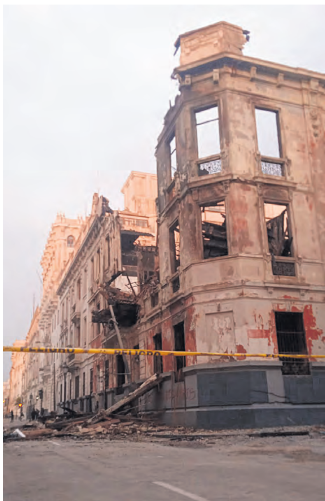
Centenaria casona quemada en la plaza San Martín.

debe ser la de instruir a sus Embajadores diplomáticos y políticos, a que se dediquen a representar la verdadera posición del gobierno, emitiendo pronunciamientos a favor del Estado de derecho, en los foros y medios internacionales.