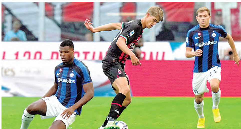
Partido entre los gigantes de Italia será en Arabia.

INTER Y MILAN se enfrentan en partido único en el estadio Rey Fahd de Arabia Saudita.