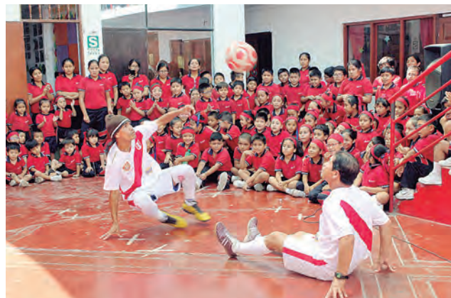
Todas sus hazañas son para que los disfruten los niños.

sus 33 años de trayectoria apenas solo una vez salieron de Perú. Fue en el 2002, cuando estuvieron