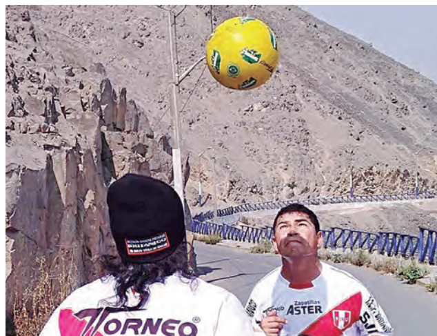
Tiene récord de kilometraje subiendo al cerro San Cristóbal.

LOS HERMANOS FIGUEROA , los malabaristas con el balón, tiene más de 50 récords mundiales, pero ninguno fue homologado por el Libro Guinness al no tener dinero para pagar la inscripción.