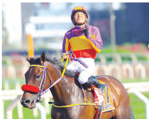
Esta es Rima (afuera), hija de Classic Leader que ganó su examen, crianza del Hamide.