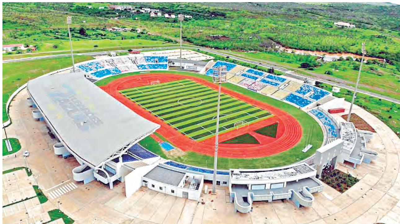
El primer escenario de Cabo Verde tendrá el nombre del "Rey" Pelé.