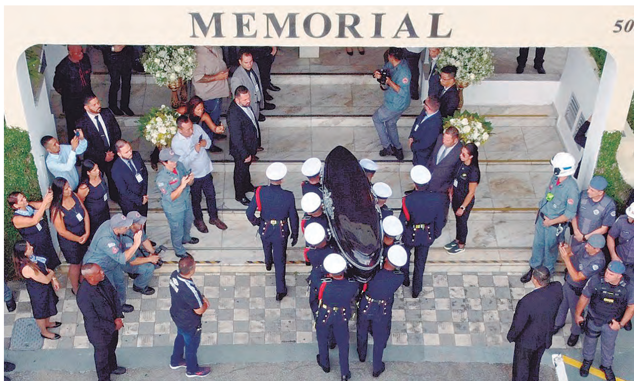
Los restos de Pelé ingresando al cementerio en el último adiós de la "torcida".

cerrada con la presencia de familiares en el Memorial Necrópole Ecueménica, el cementerio vertical más alto del mundo con 14 pisos, según el Récord Guinness.