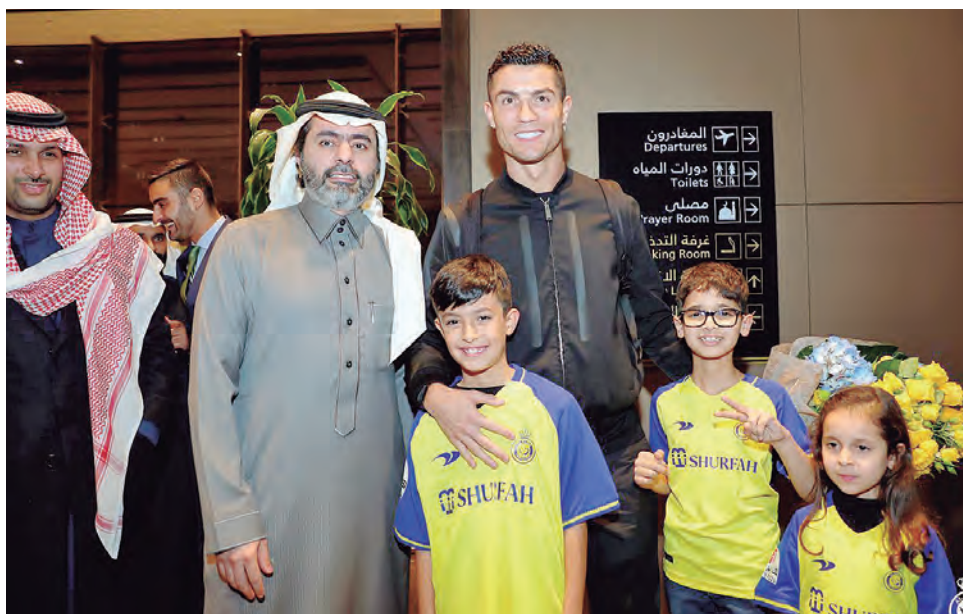
Una gran presentación tuvo CR7 con su nuevo club Al Nassr.

CRISTIANO RONALDO fue presentado ayer como jugador del Al Nassr de Arabia Saudita, con el cual debutaría mañana jueves en la Liga.