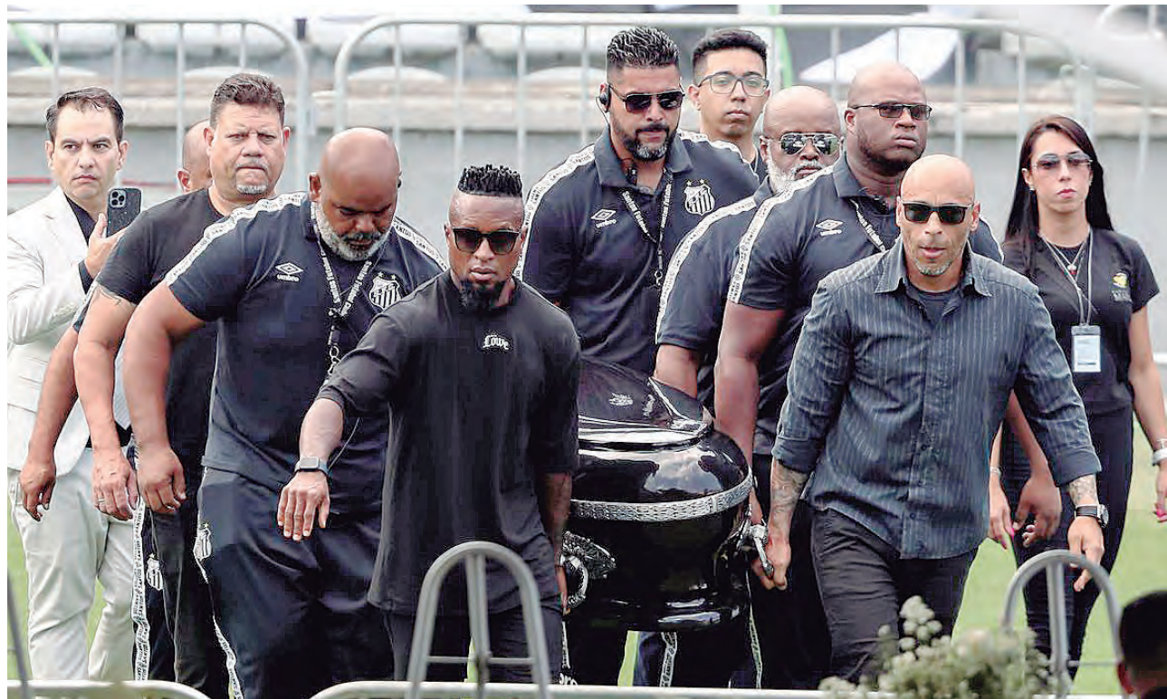
Emotivas escenas, se apreció en el velorio del "Rey" Pelé en Vila Belmiro.