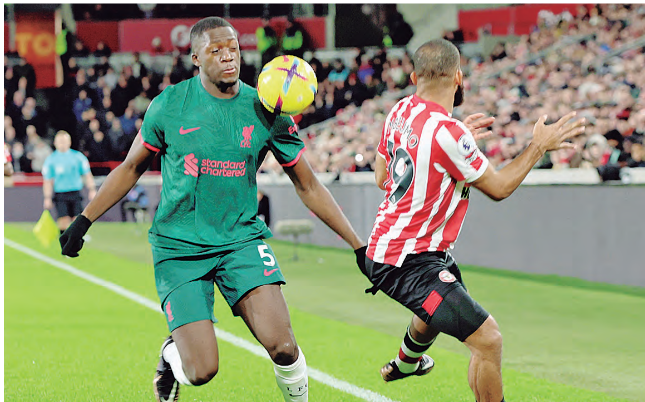
Dura derrota de los “reds” en su vuelta a la Premier.

La superioridad de Brentford continuó sintiéndose y a los 39' logró el segundo gol para irse al descanso ganador, gracias