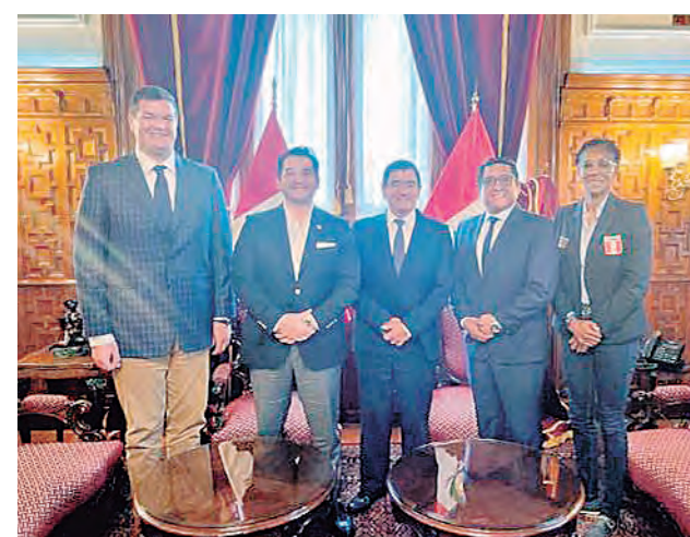
Comité Olímpico de la mano con los deportistas.

Además, en esta reunión llevada a cabo en la sede del Congreso de la República se plantearon necesidades y propuestas de reformas legislativas a favor del deporte con miras a mejorar el apoyo al deportista con miras a eventos como los Juegos Panamericanos Santiago 2023 y los Juegos Olímpicos París 2024.