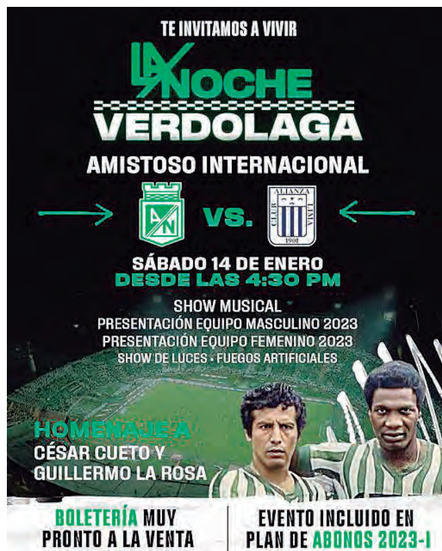
Afiche de la presentación del amistoso y el homenaje a Cueto y La Rosa.

Las puertas del Estadio Atanasio Girardot, se abrirán desde las 4 de la tarde, y habrá además de la presentación de los planteles masculino y femenino 2023, show musical, show de luces, el homenaje a Cueto y La Rosa y como acto central el amistoso entre Atlético Nacional y Alianza Lima.