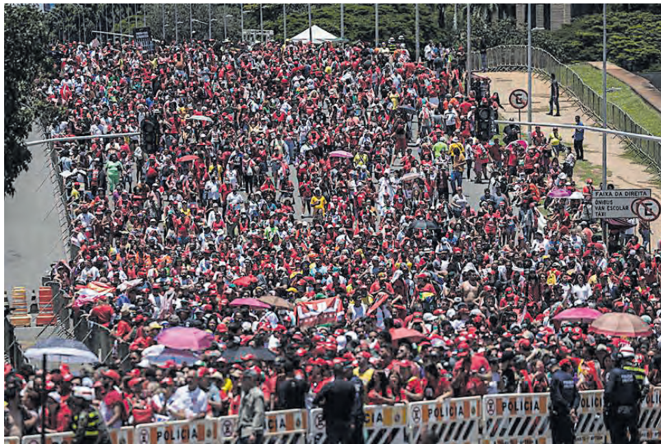
Miles de seguidores del presidente electo de Brasil Luiz Inácio Lula da Silva, se reunieron en la plaza de los poderes para celebrar la posesión presidencial de Lula, en Brasilia

asumo el compromiso de, junto con el pueblo brasileño, reconstruir el país y hacer nuevamente