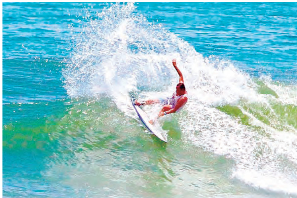
Los cargos que ostenta es un mérito para el deporte peruano.