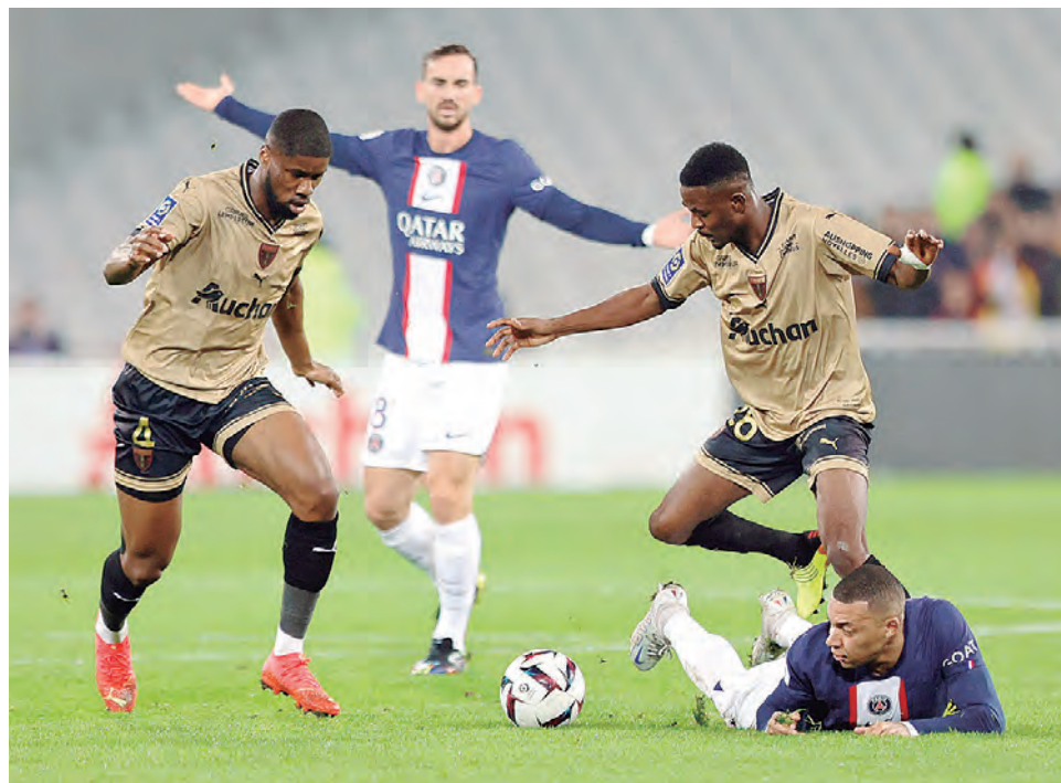
Los parisinos cedieron tres puntos en su visita al Lens.