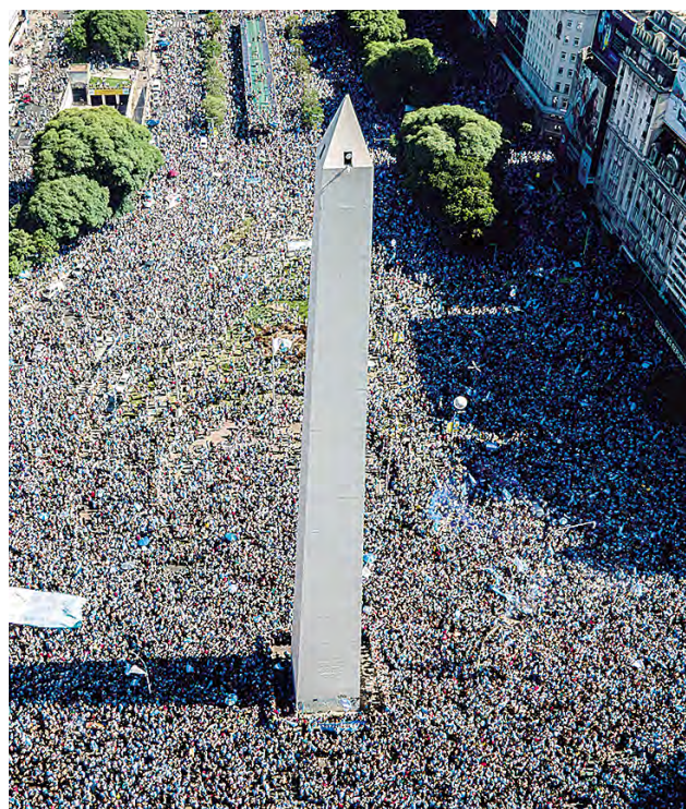
Debe ser un multitudinario recibimiento.

LA SELECCIÓN ARGENTINA llegó en la madrugada y luego de descansar harán clásico recorrido en un bus descapotable y saludarán a la hinchada desde la Casa Rosada.