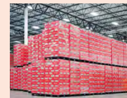
QUE NO SE VENDIO

El presidente de la República Alberto Fernández puso a disposición la Casa Rosada para que los jugadores festejen desde el balcón de la Casa de Gobierno frente a la Plaza de Mayo, y habría planteado no estar en esa foto que sería histórica y quedaría a la par de lo que fueron los regresos de los campeones de México 86 y los subcampeones de Italia 90.