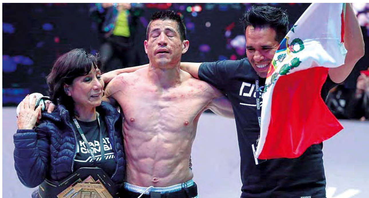
Junto a Sarria su entrenador.