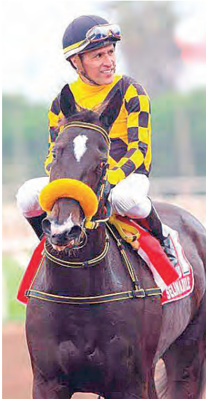
Dominó a las fondistas a su antojo en Monterrico.

bes sostiene que la principal ventaja de Paradigma es su salud. “A pesar de la exigente campaña, se mantiene excelente. Chipana (su varedador) está muy optimista al igual que todos en el Stud. Es un caballo de unos 510 kilos, muy fuerte y listo para este fin de semana”, concluyó con las ilusiones a millón.