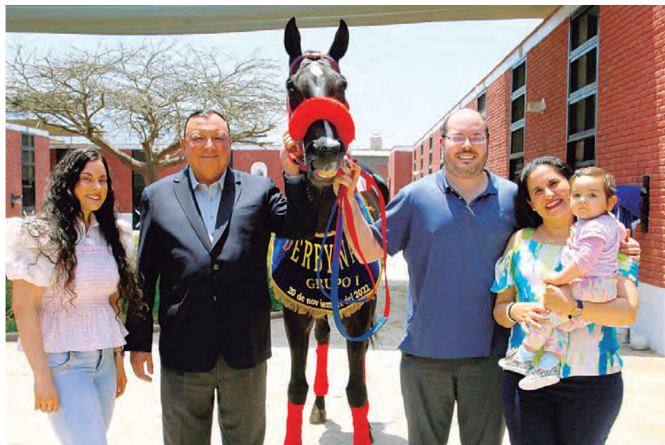
Familia Guembes disfruta del virtual campeón de la generación