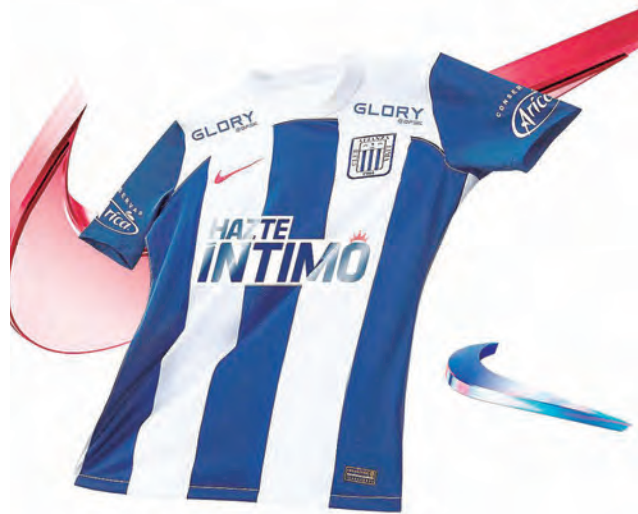
Este es el nuevo diseño de la casaquilla íntima para la siguiente temporada.

El modelo que Alianza Lima vestirá la próxima tem-