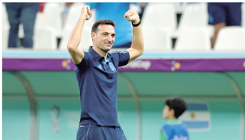
Scaloni arregló el problema de la posición de Messi.

TÉCNICO ARGENTINO confesó que planificó el partido pensando que la volante croata tendría el control en los primeros minutos.