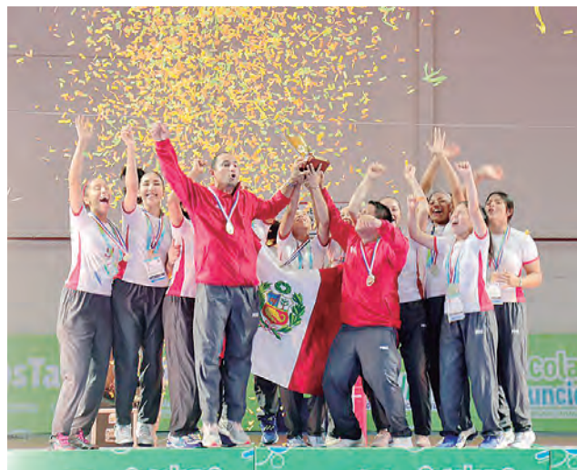
Grita en todo la alto la selección peruana de vóley escolar.

DELEGACIÓN INCAICA ACABÓ cuarto en los Juegos Sudamericanos Escolares que se desarrollaron en Asunción. Brasil y Argentina fueron con escasas delegaciones.