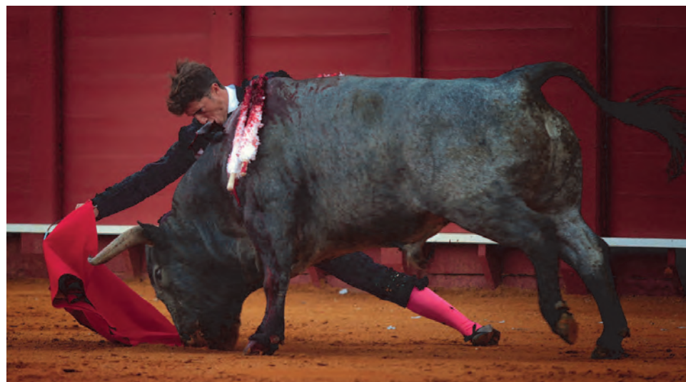
Cobradiezmos y Escribano hicieron historia en 2016, en la plaza de Sevilla (Foto: Maurice Berho).

"La acometividad, la entrega y la obediencia son los tres pilares que constituyen la bravura del toro...", dijo el