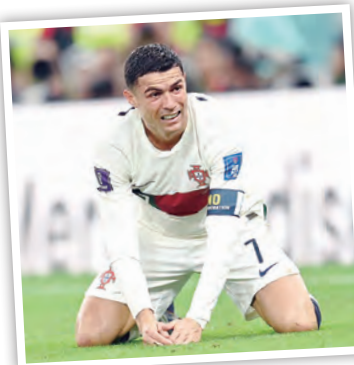
Ronaldo se despidió de los mundiales.

se metían en su defensa lanzaban el palotazo.