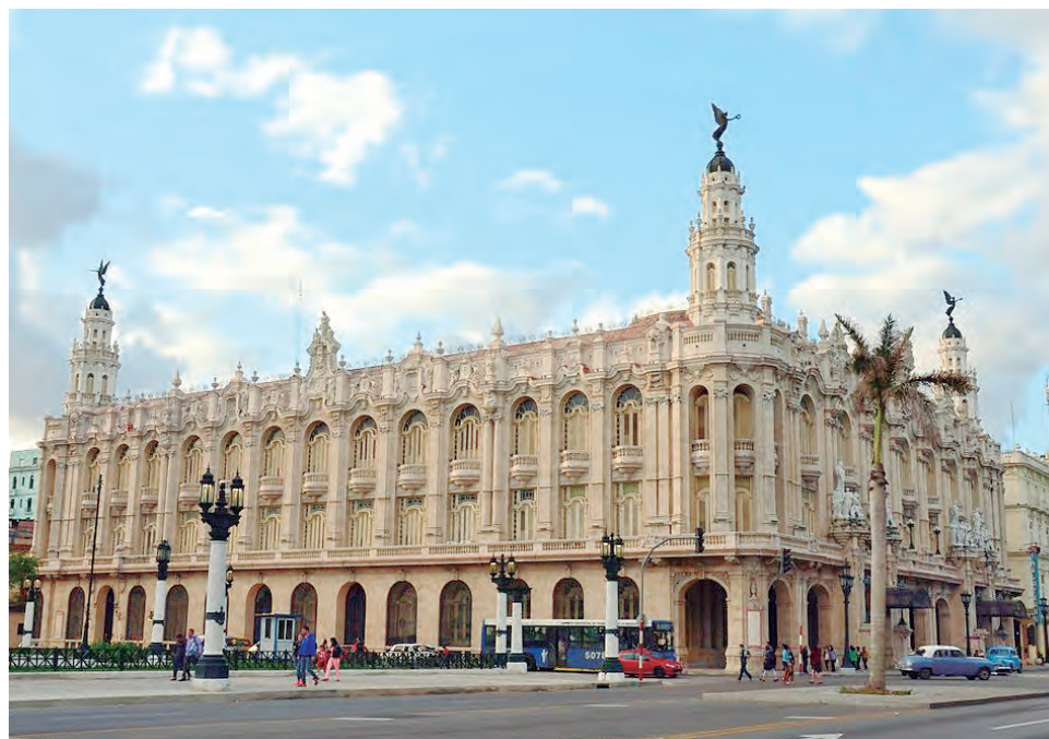
Ciudad de La Habana, Cuba, sede del importante Foro Mundial del pensamiento plural.