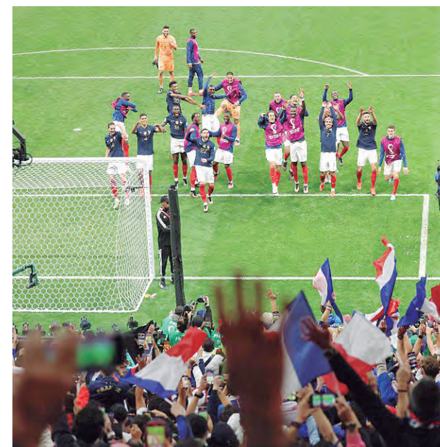
Francia celebra, está prácticamente en la final.

Lo ejecutó Kane y mandó la pelota fuera del arco. Por más que el técnico Southgate mandó a cinco delanteros en los minutos finales y tuvo un tiro libre muy peligroso, Francia como en el mundial pasado está entre los cuatro primeros del mundial.