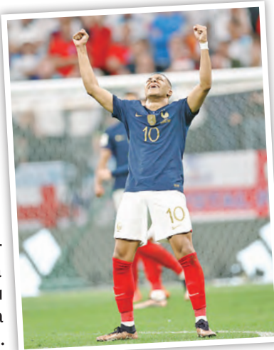
Mbappe celebra su pase a semifinales por segunda vez consecutiva.

Mbappe estuvo en un duelo individual con Walker, pese a ganar casi siempre, pocas veces le sacó provecho. Más bien, al no apoyar la marca, Inglaterra comenzó a recostar su juego por la derecha con Henderson y Saka. Al otro lado, Dembelé estaba muy activo, pero sin ganar un duelo individual a Shaw.