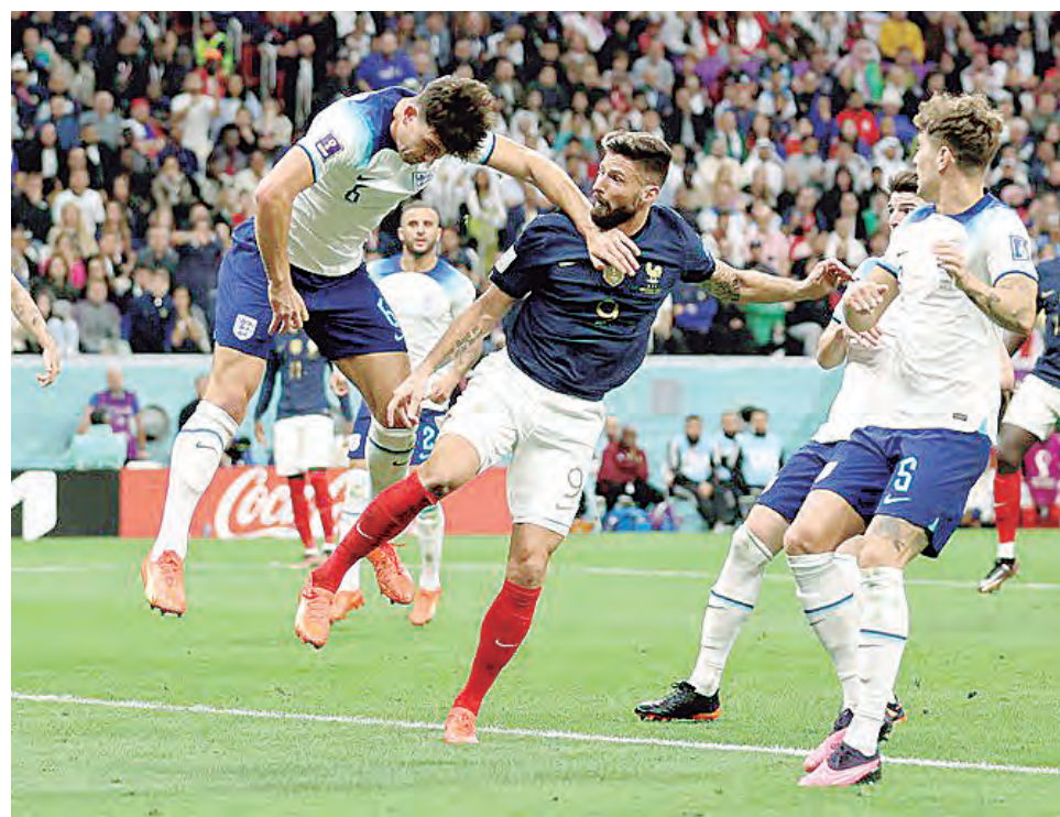
Giroud con golpe de cabeza anota el 2-1 final.

Fue un duelo táctico en los primeros minutos que lo rompió Tchouameni con un gran gol de media distancia. Hasta ese momento, Inglaterra realizaba su plan con el control del balón en su campo, buscando los espacios para realizar el pase de ruptura. Francia era más vertical con Griez-