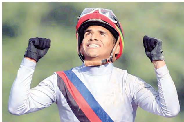
Es líder con 147 triunfos este año

de Capri, del Jet Set, que siempre descuenta en el final y Ratko, otro que falló en el Derby Nacional y ahora en la milla buscará un mejor rendimiento. La