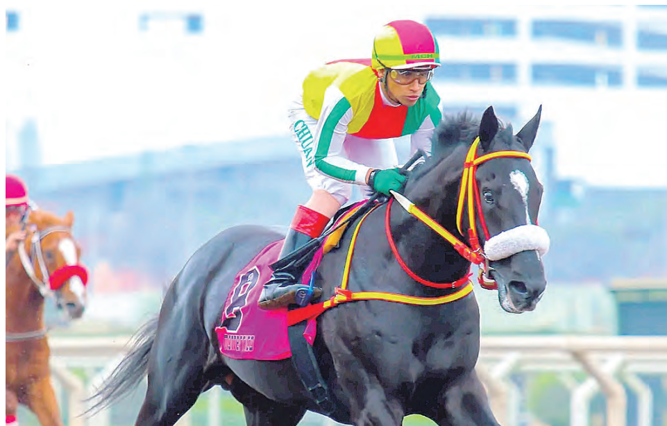
El zaino del Agustín Gabriel a su prueba de fuego