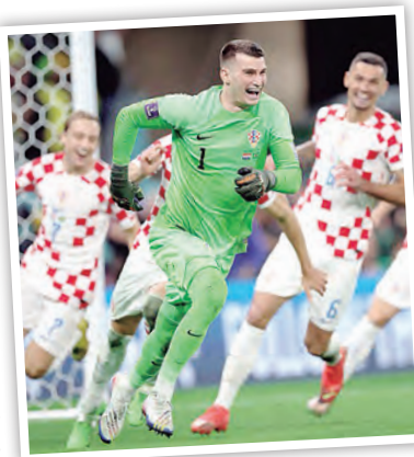
La celebración efusiva de Croacia que se metió otra vez entre los 4 mejores.

la posición de Modric que en los partidos anteriores estuvo jugando como volante por derecha y lo mandó detrás del punta que esta vez fue Kramaric. Mandó a los extremos Perisic y Pasalic a estar muy colaboradores en la marca.