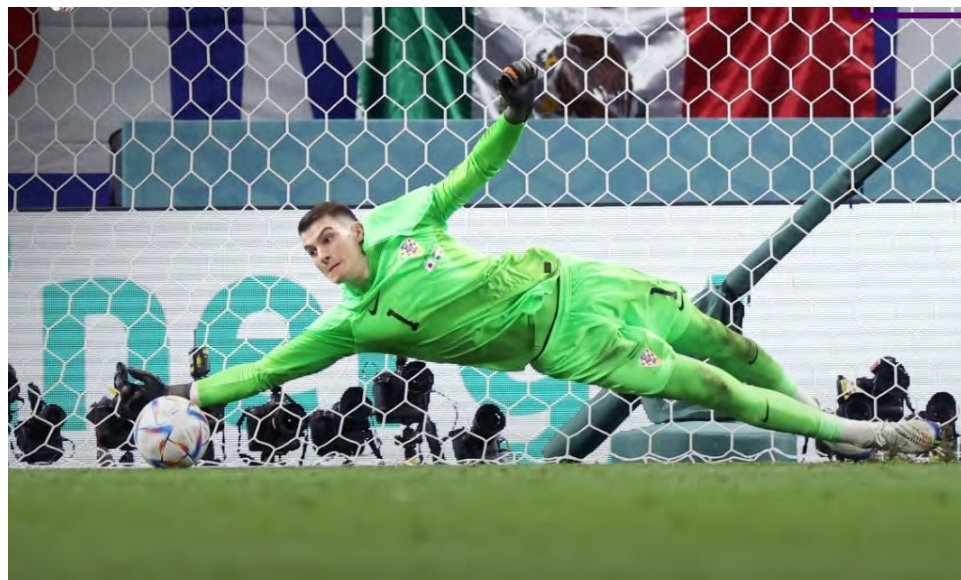
Livakovic atajó tres remates desde el punto penal.

Pese al esfuerzo japonés, como Costa Rica ante Holanda en el 2014 o México frente a Alemania, en 1986, el equipo con los jugadores de mayor jerarquía se impone en esta circunstancia. Croacia que ya había pasado los octavos y los cuartos de final en