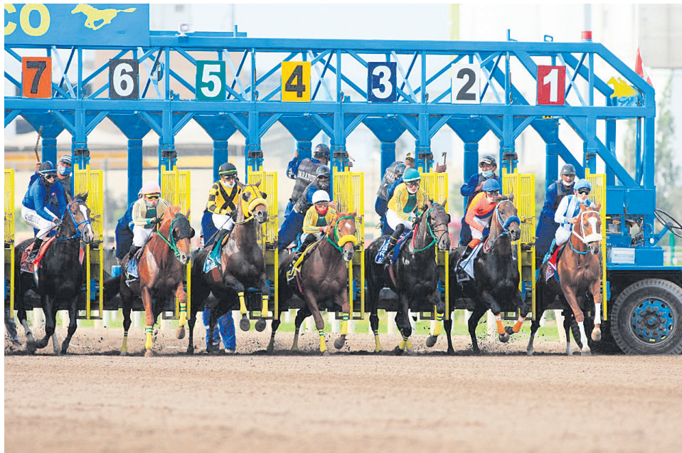
La jornada dominical iniciará a la 1 pm

EL HIPÓDROMO DE VISTE DE GALA CON EL DERBY NACIONAL (G1), ACTIVIDADES PARA TODA LA FAMILIA