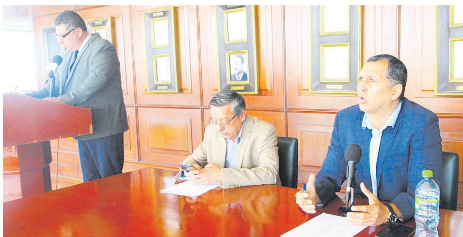
La Comisión Organizadora promete una tarde inolvidable

El esfuerzo desplegado en el manejo financiero y así como el cuidado de los recursos, en una gestión institucional transparente, nos permite avizorar mejores aires para el futuro, y que permitan el despegue que tanto deseamos.