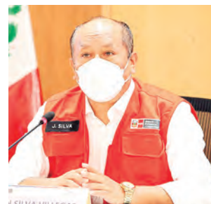
Fiscales contra la Corrupción del Poder.

declaró fundado su pedido contra Sánchez Córdova, quien es investigada por la presunta comisión del delito de lavado de activos por el Equipo Especial de