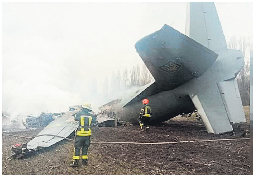
Extraño combate en los cielos de Kiev.

Pese a que las tropas ucranianas se habían retirado del frente hace dos días para reagruparse, iniciaron un ataque en cuatro direcciones para avanzar en Kupyansk, Liman, en la región de Kherson y Zaporozhye. Luego de un inicio prometedor, llegaron hasta la misma primera línea de defensa rusa, sin embargo, no pudieron consolidar su progreso y tuvieron que retroceder. “Las pérdidas totales de las Fuerzas Armadas de Ucrania y mercenarios por