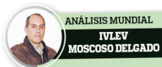
ANÁLISIS MUNDIAL IVLEV MOSCOSO DELGADO

SÓLO CUANDO SALIERON Barco y Barreto, los cremas mejoraron. César Vallejo lo venció 1-0 y otra vez hubo apagón en el estadio.