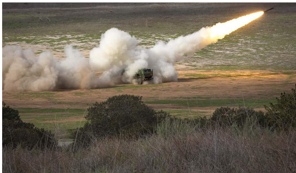
Los misiles que proporcionó EEUU a Ucrania pueden alcanzar el territorio ruso.

Contra su territorio o responderá con graves consecuencias para Ucrania sostuvo un alto funcionario del Kremlin.